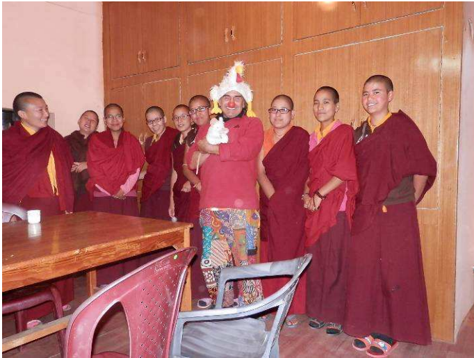
giovani ospiti del monastero di Pagan dove installeremo luci ad energia solare