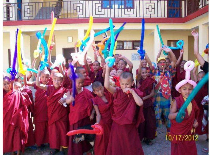
inaugurazione della nuova scuola