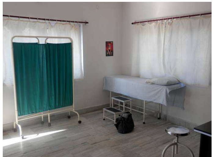
attrezzature mediche all'interno del nuovo dispensario