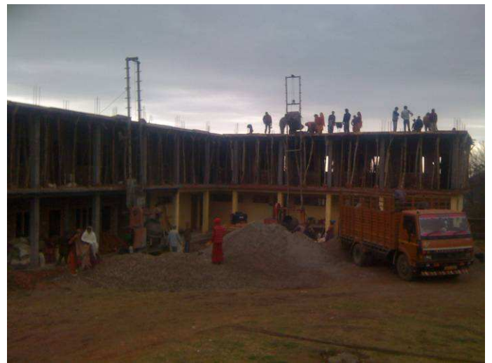
costruzione piano superiore