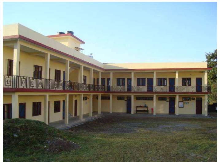
fase finale della costruzione