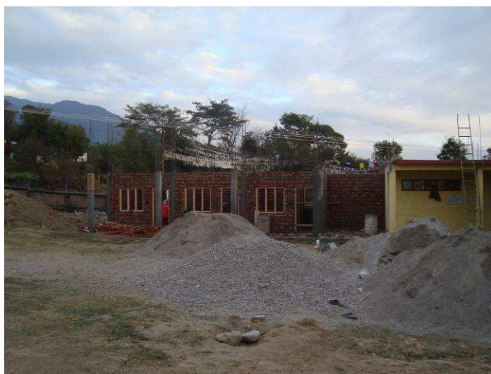
inizio costruzione piano terra