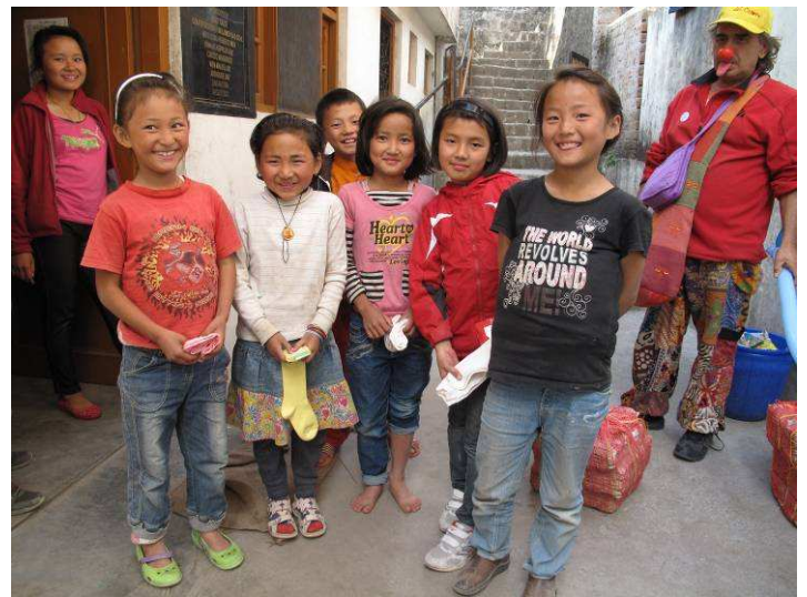
distribuzione di calzini