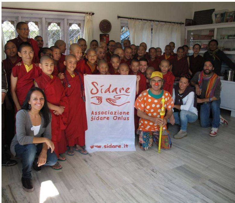
volontari di Sidare all'interno del dispensario