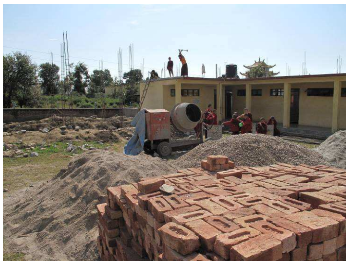
scavo delle fondamenta