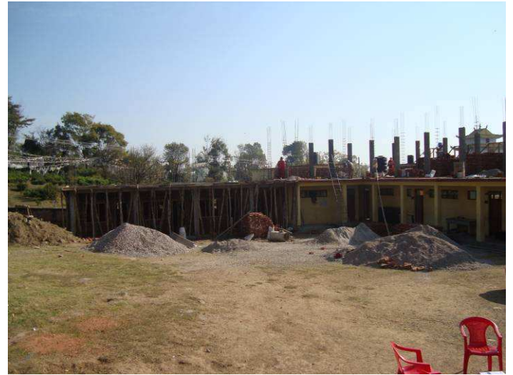
costruzione piano terra