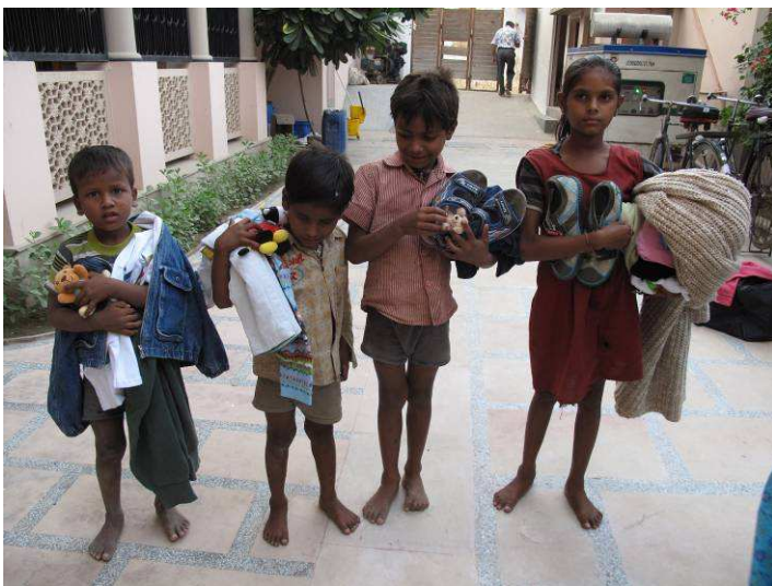
distribuzione di indumenti, giochi e scarpe ai bambini incontrati