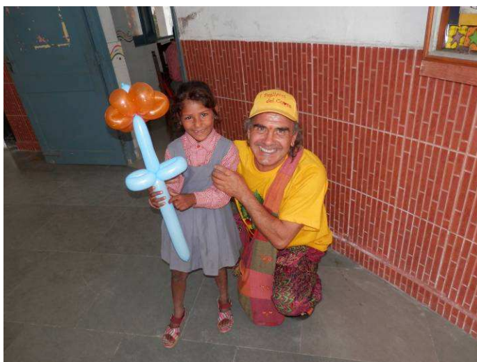
il clown Chapati