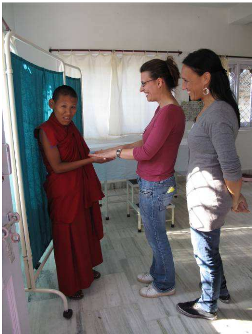
visita alle pazienti del monastero –scuola